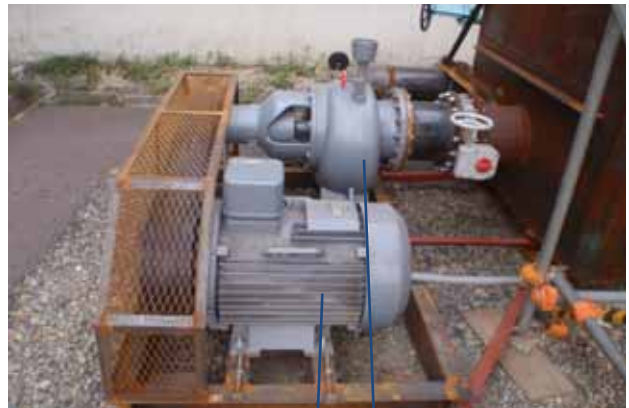
45KW6P 電動機 インバータによる 変速運転