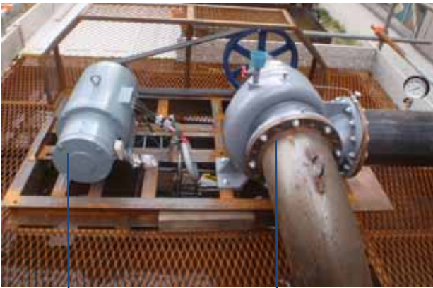
同期発電機 1500rpm (30KVA)