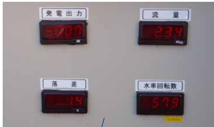
データ表示盤 ・発電出力 ・流量 ・落差 ・水車回転数